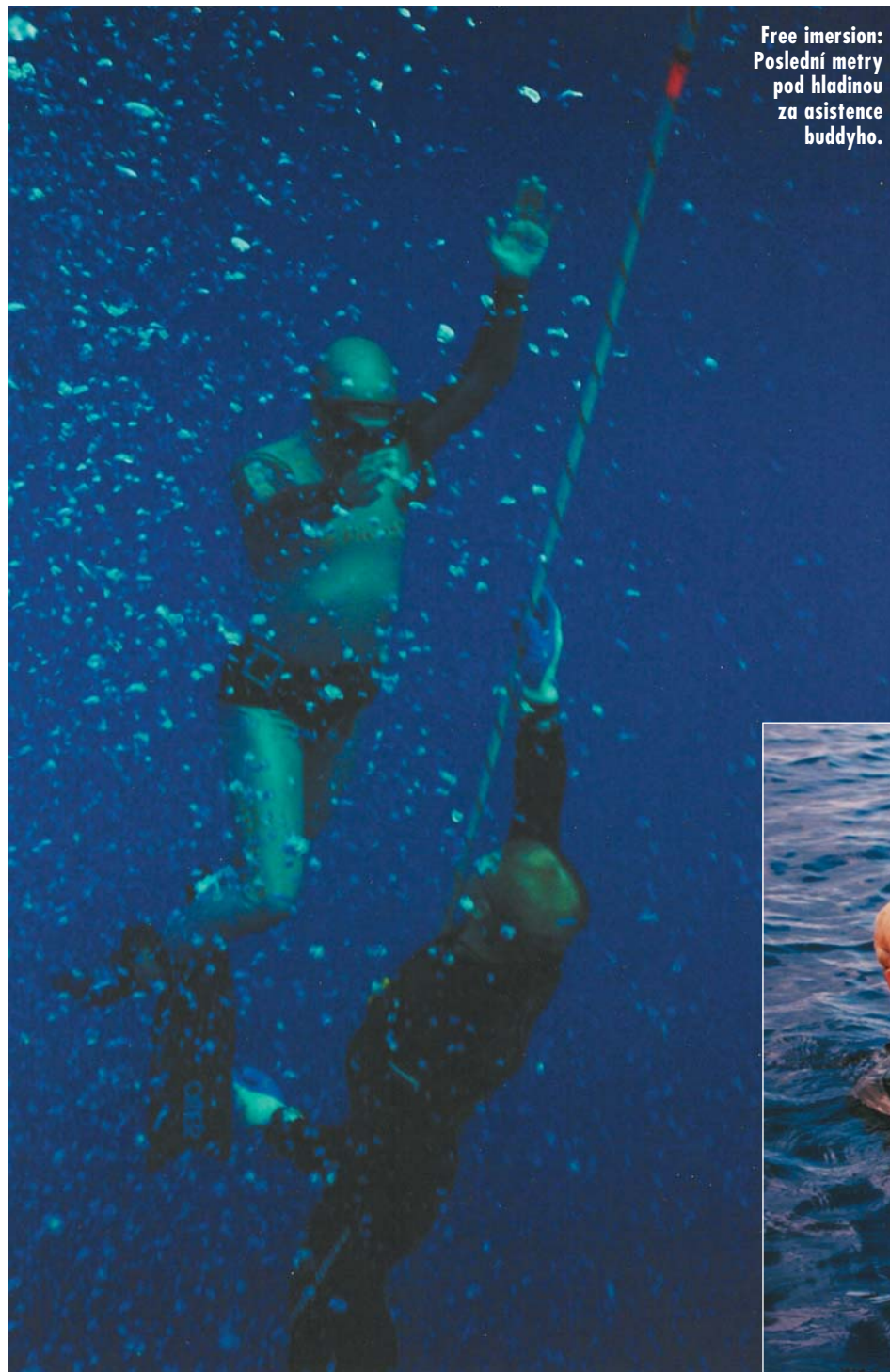
Free imersion: Poslední metry pod hladinou za asistence buddyho.